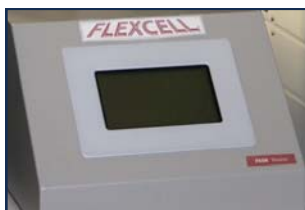
图13. FlexLink Tension System 控制器.